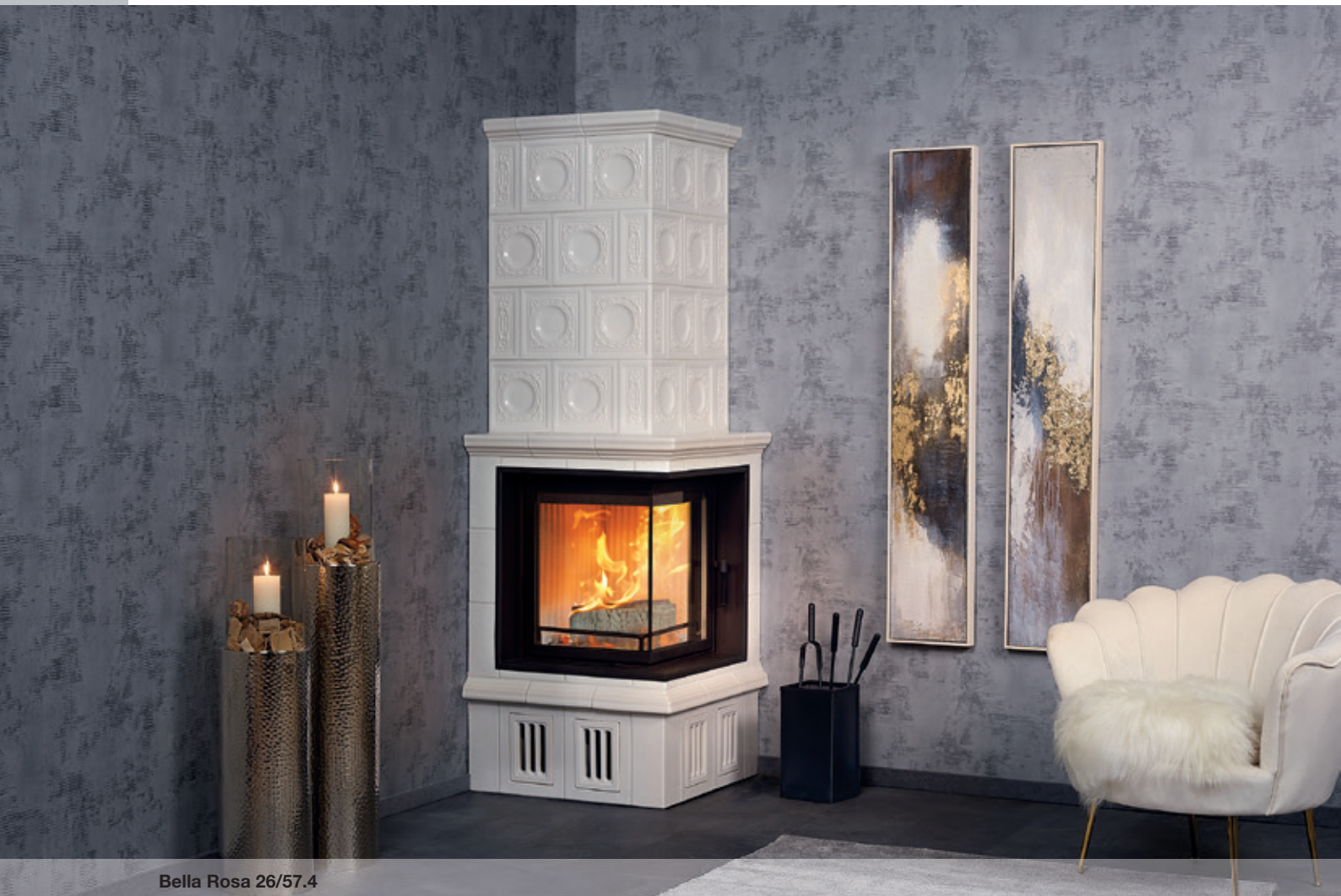
Bella Rosa 26/57.4

GmbH & Co. KG HARK ® Die 1 Nr. 1 im Kamin- und Kachelofenbau